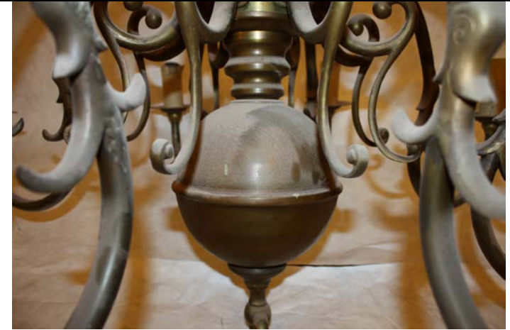
Salpicaduras de pintura y acumulación de polvo sobre bola.