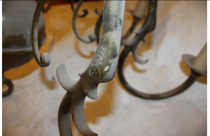
Salpicaduras de pintura y acumulación de polvo sobre uno de los brazos. Detalle de figura zoomorfa.