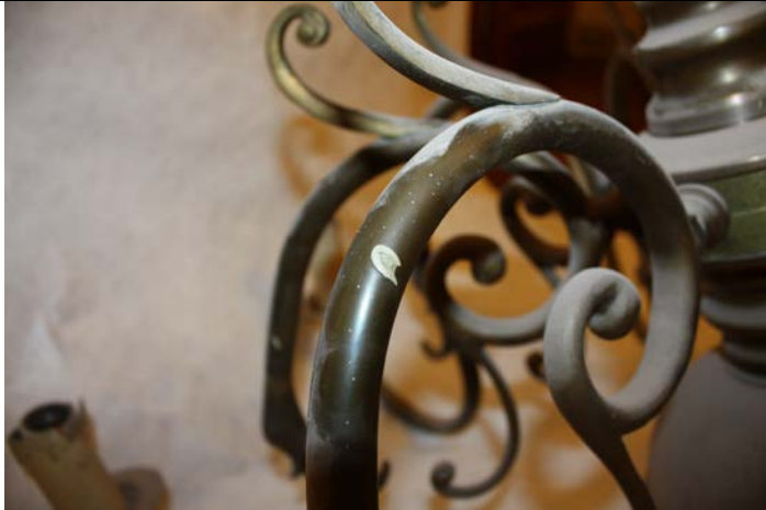
Salpicaduras de pintura y acumulación de polvo sobre uno de los brazos.