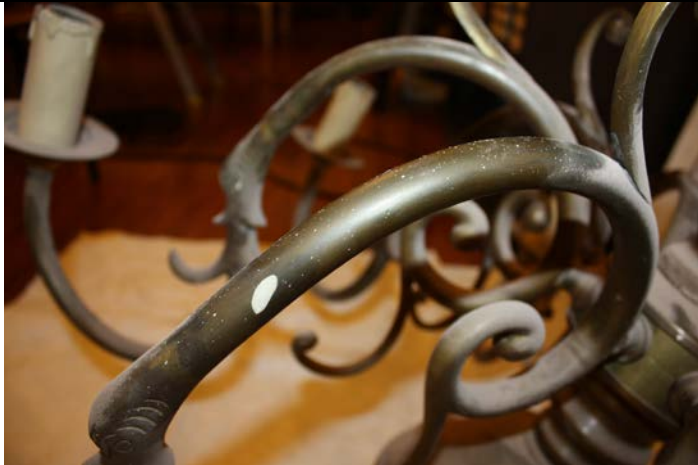
Salpicaduras de pintura y acumulación de polvo sobre uno de los brazos.