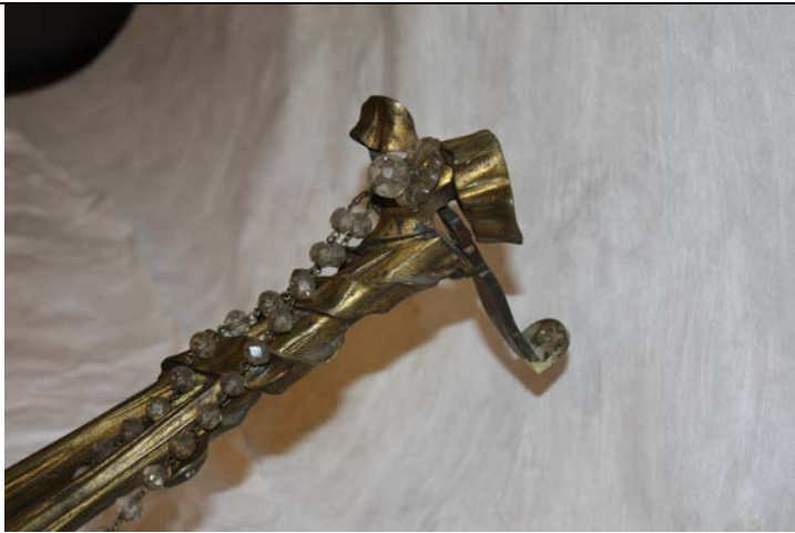
Manchas oscuras sobre el metal, extremo superior.