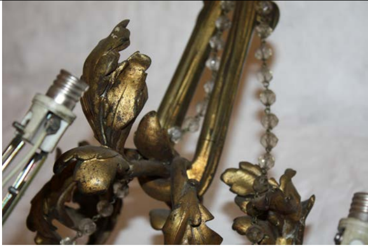
Manchas oscuras sobre el metal, detalles fitomorfos.