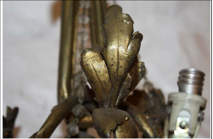
Manchas oscuras y rayas sobre el metal, detalles fitomorfos.