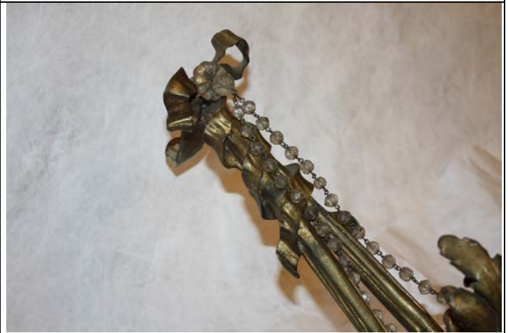
Manchas oscuras sobre el metal, extremo superior.