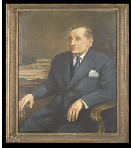
Retrato presidente Arturo Alessandri Palma