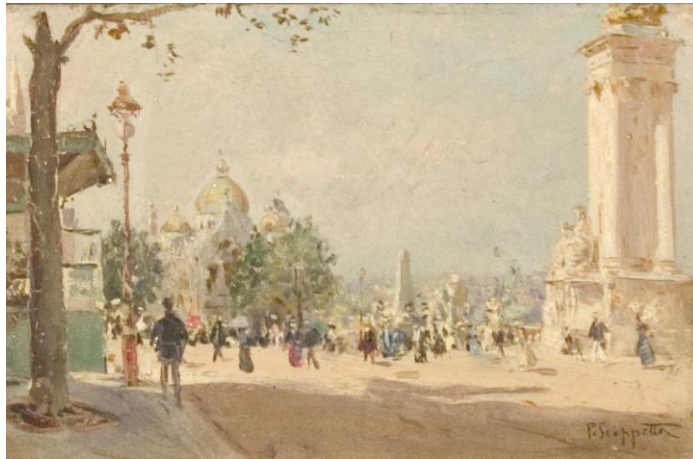
Paisaje de París (II) – Scoppetta, Pietro

La obra VUE DE VALPARAISO “PRISE AU SUD DE LA VILLE” es una vista desde los cerros de Valparaíso de sur a norte de las primeras décadas del siglo XIX. Por lo que se ve en la fotografía de la obra, corresponde a una litografía.