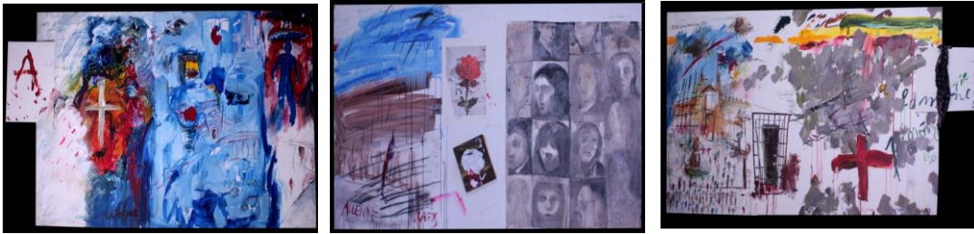
Tríptico colectivo – Balmes, José

Presidencia de la República Departamento de Patrimonio Cultural