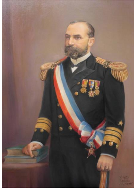
Retrato presidente Jorge Montt – Gustavo Ross

Presidencia de la República Departamento de Patrimonio Cultural