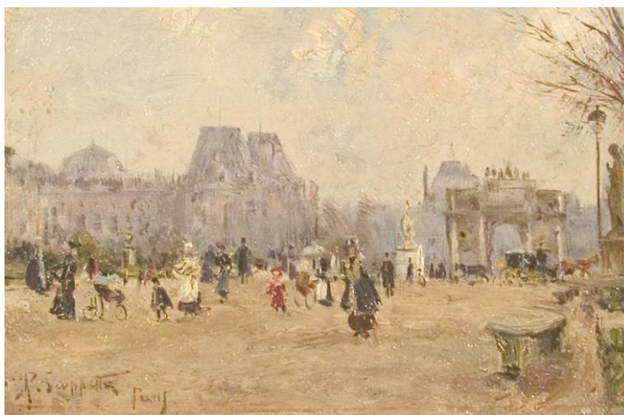
Paisaje de París (II) – Scoppetta, Pietro