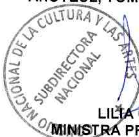
LILIA CONCHA CARREÑO MINISTRA PRESIDENTA SUBROGANTE CONSEJO NACIONAL DE LA CULTURA Y LAS ARTES