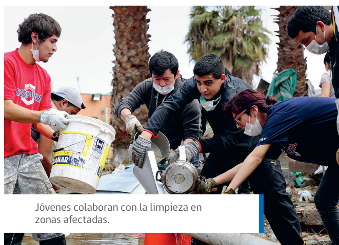
Jóvenes colaboran con la limpieza en zonas afectadas.