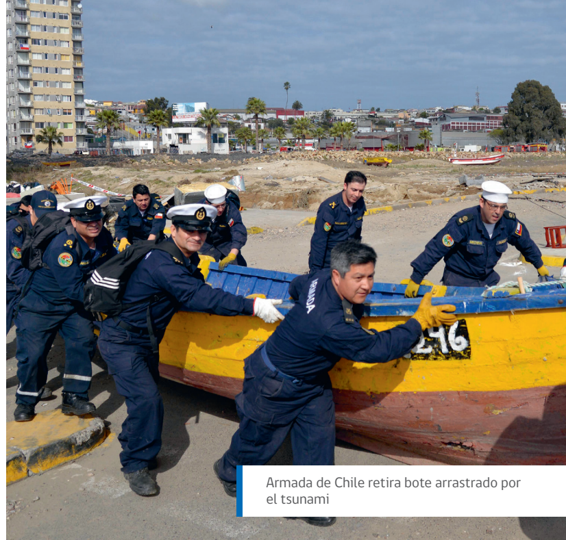
Armada de Chile retira bote arrastrado por el tsunami

Uno de los principales apoyos es la llegada del buque Hospital Sargento Aldea , al que se sumará la instalación de un hospital de campaña para apoyar las tareas del Servicio de Salud y entregar atención médica a todos quienes la requieran.