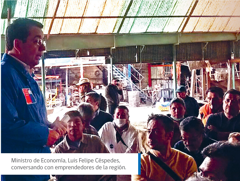
Ministro de Economía, Luis Felipe Céspedes, conversando con emprendedores de la región.