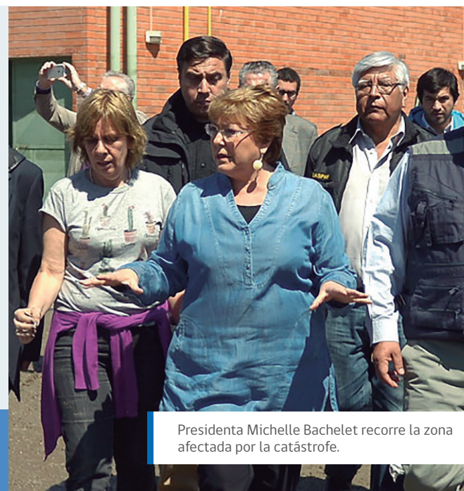
Presidenta Michelle Bachelet recorre la zona afectada por la catástrofe.

Para dudas acerca del Programa Reemprende Coquimbo o preguntas específicas para Sercotec, Corfo y la Seremi de Economía, se debe llamar al teléfono 051-2214814 (Seremi de Economía, Región de Coquimbo).