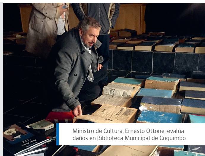
Ministro de Cultura, Ernesto Ottone, evalúa daños en Biblioteca Municipal de Coquimbo

Los interesados pueden acercarse a la Dirección Regional del Consejo de la Cultura, ubicada en calle Colón 848, La Serena.