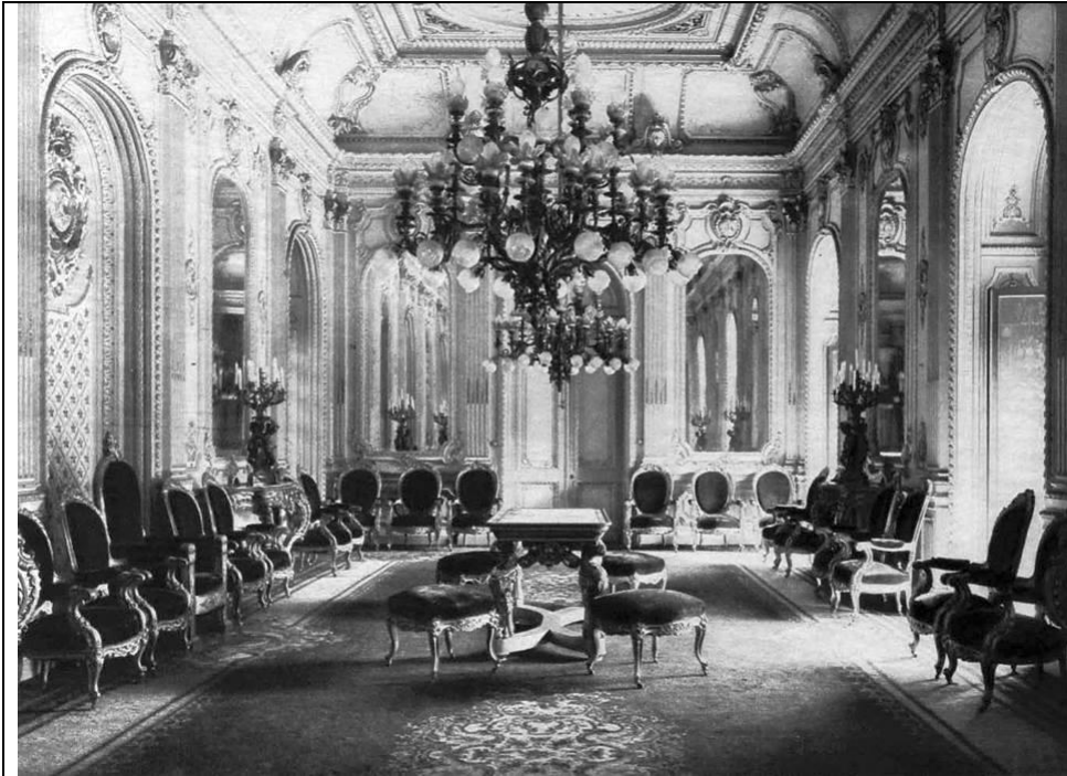
Salón de Honor, Palacio de La Moneda.

Área de Investigación Departamento de Patrimonio Cultural Presidencia de la República