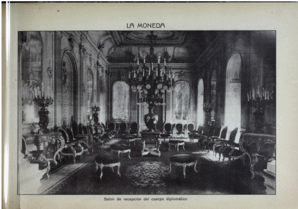
Salón de recepción del cuerpo diplomático. En: J. Walton. Álbum de Santiago. Vistas de Chile. 1.er Tomo. Santiago: Sociedad Imprenta y Litografía Barcelona, 1915.