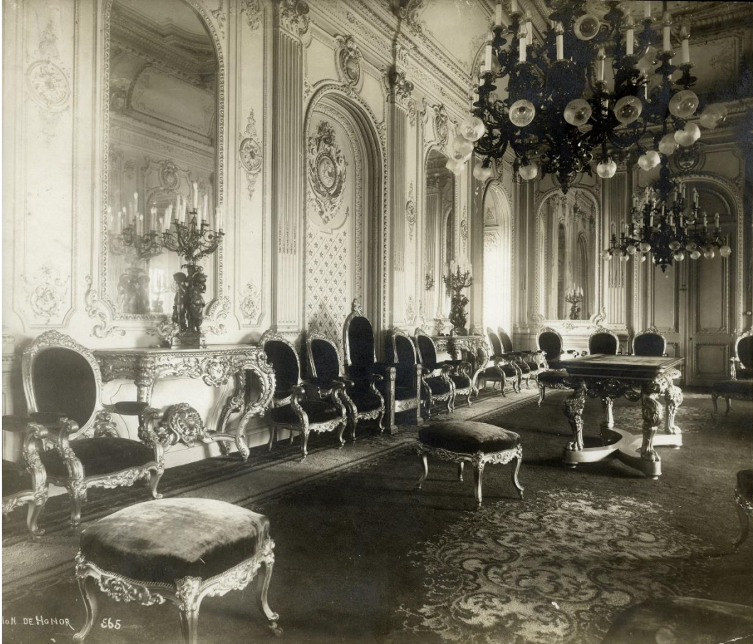
Salón de Honor, Palacio de La Moneda, 1910.