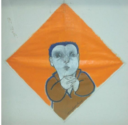
Gonzalo Cienfuegos, Volantín de Género "Gonzalo Cienfuegos" , técnica mixta sobre tela, 76,3 x 76,3 cm. Presidencia de la República de Chile.

Área de Investigación Departamento de Patrimonio Cultural Presidencia de la República