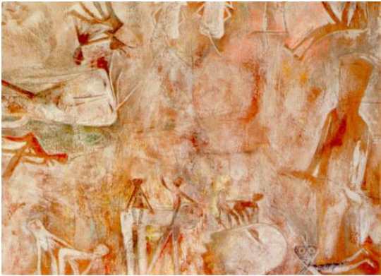
Hugo Marín, Mundos Incandescentes , pastel sobre papel, 41 x 56,5 cm. Museo de Artes Visuales MAVI, Santiago de Chile.