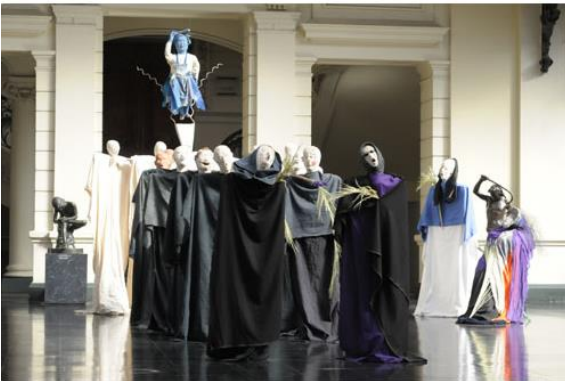
Hugo Marín, Peregrinaje , 2010, Instalación, Hall Museo Nacional de Bellas Artes, Santiago de Chile.