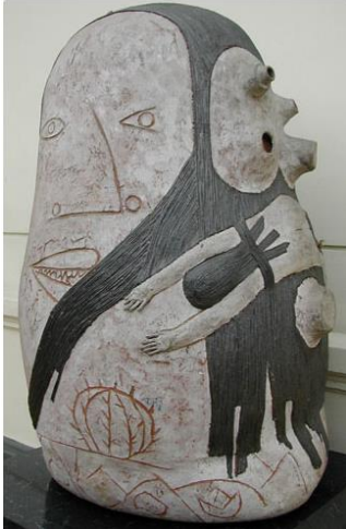
Hugo Marín, Pachamama , 1990, técnica mixta, 130 x 90 cm. Museo Nacional de Bellas Artes, Santiago de Chile.