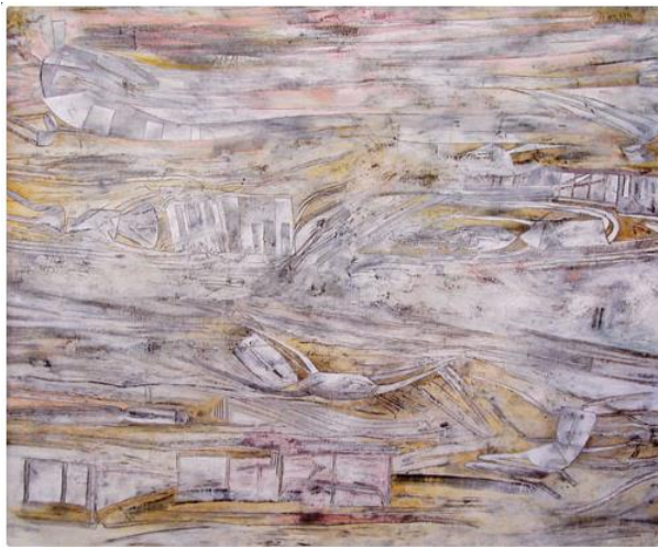
Hugo Marín, Brujas de Vichuquen , 2001, técnica mixta, 100 x 120 cm. Pinacoteca de la Universidad de Talca, Chile.