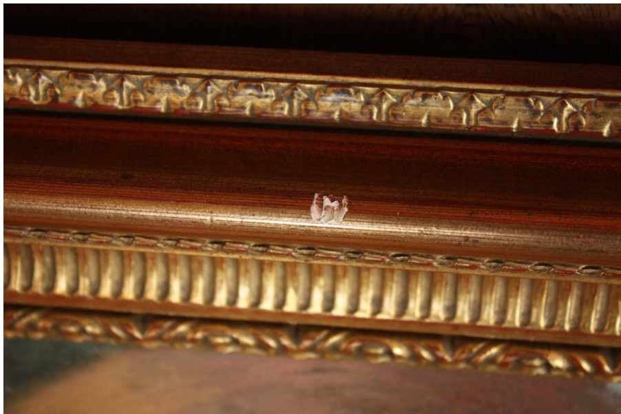
Abrasión en moldura del marco