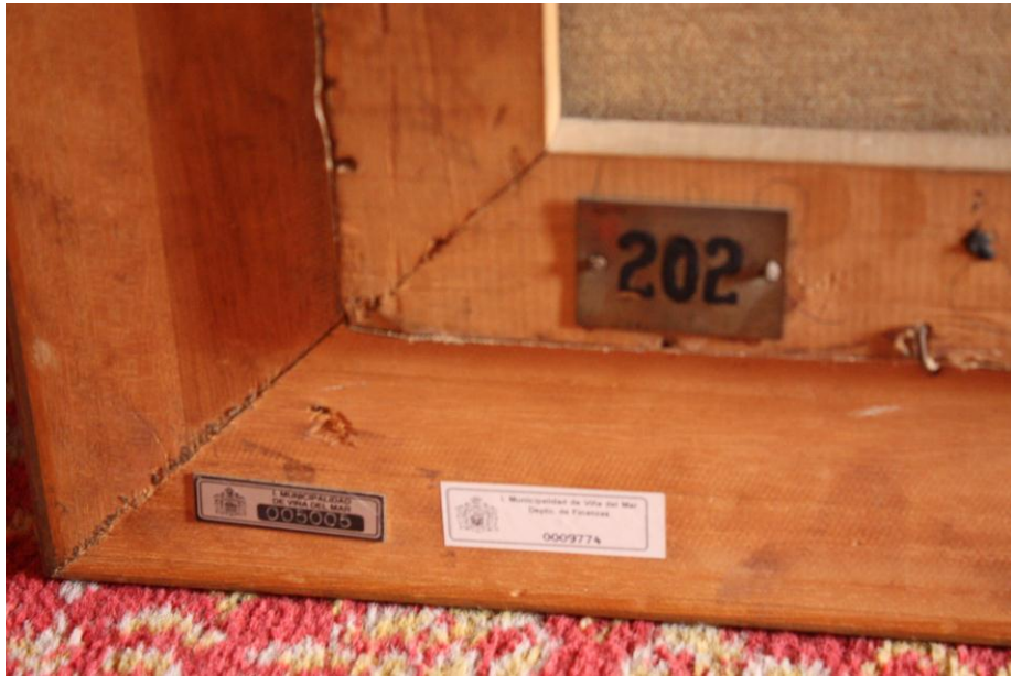
Placas de metal y etiqueta de papel en el reverso de la obra