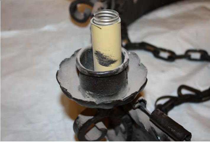
Acumulación de polvo sobre soquete y plato.