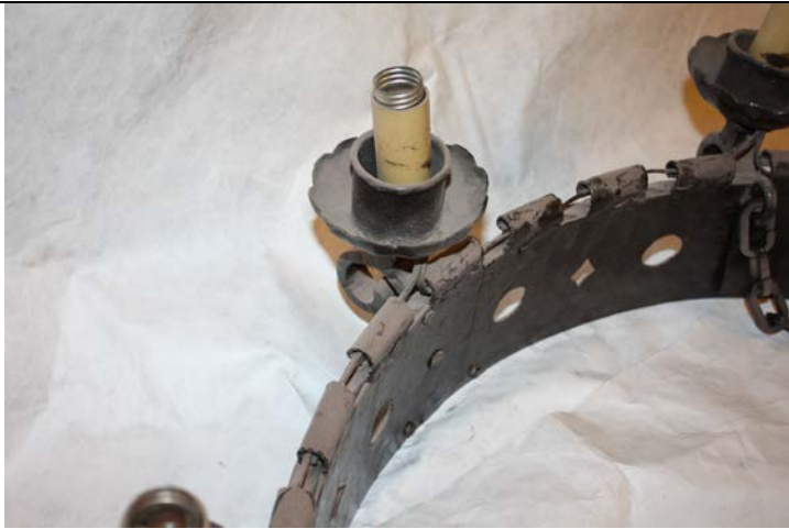
Acumulación de polvo sobre soquete y borde del aro principal