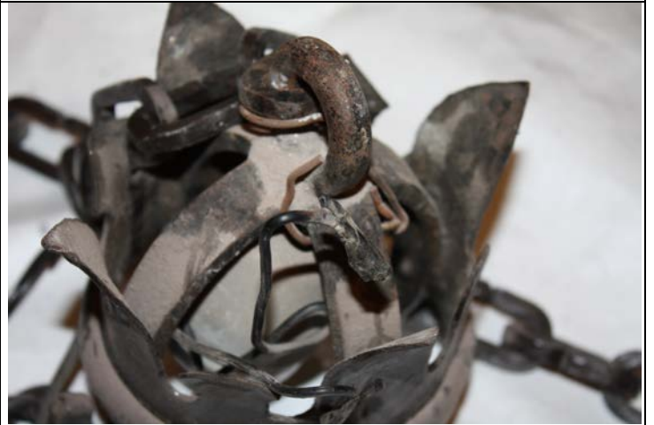
Acumulación de polvo y oxidación del aro de sujeción al cielo.