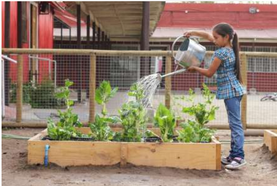
Huerto Familiar, La Pintana.

Finalmente, la información de acciones se presenta desagregada por cada uno de los Centros Familiares y agrupadas por regiones.