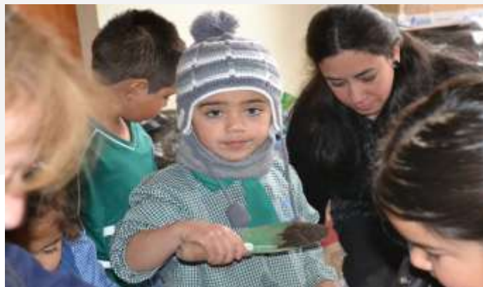
Huertos, Cerro Las Cañas, Valparíso.

Este modelo actúa articulando el enfoque comunitario y sistémico dialogando permanentemente con las áreas de desarrollo implementadas por Fundación. En ese sentido, este enfoque proporciona la integración de distintos niveles que influyen en el individuo y en su desarrollo como ser humano.