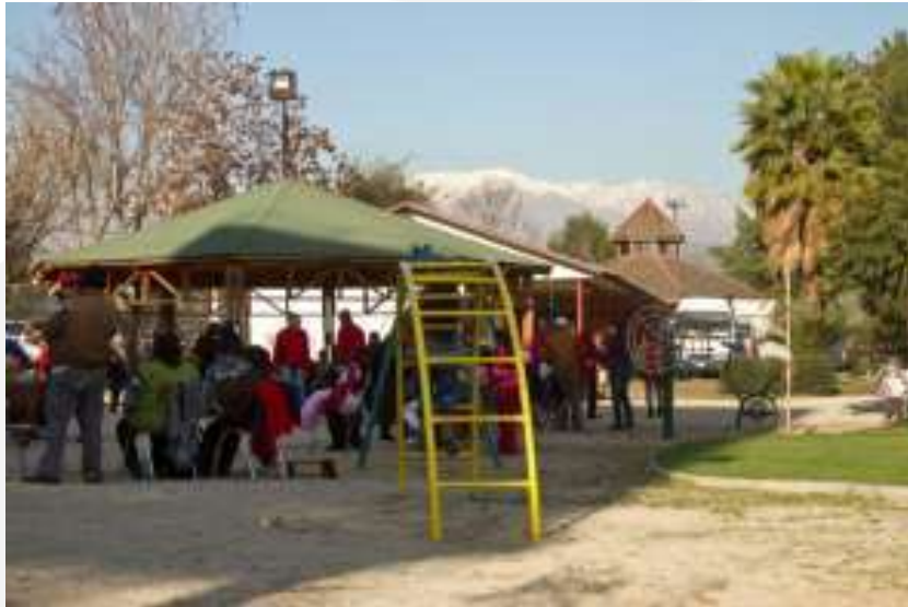
Centro Familiar de Recoleta

Se espera profundizar en la comunicación interna de la institución, promoviendo el diálogo y reflexión sobre las prácticas desarrolladas en vías de construir nuevos conocimientos. Asimismo, al instalarse el modelo como discurso y práctica común de los equipos de Fundación de la Familia, no sólo se potenciará la identidad y coherencia, sino que también se promoverá el posicionamiento de la institución con una imagen clara a nivel país, facilitando el trabajo con otras instituciones y redes locales.