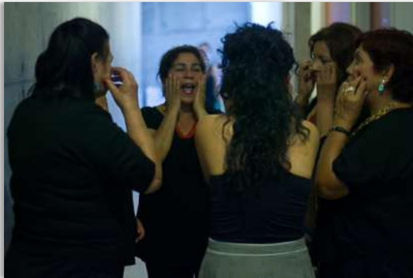
Muestra de teatro, Región Metropolitana

Los resultados de esta evaluación serán de suma utilidad para entender y complementar la información cuantitativa referida en la parte anterior del informe, así como para contextualizar el trabajo de Fundación de las Familias en el ámbito comunitario. Finalmente, se espera que los antecedentes aquí recogidos den cuenta del avance registrado en la calidad del trabajo con familias desarrollado y contribuyan a generar evidencia que aporte en la consolidación del modelo de trabajo proyectado para el 2015. Las categorías referirán en términos generales a los principales atributos que los participantes asignan a Fundación, los aspectos más significativos de su propia experiencia y finalmente, como síntesis, a los aspectos que los participantes han ido incorporando desde el modelo de trabajo con familias