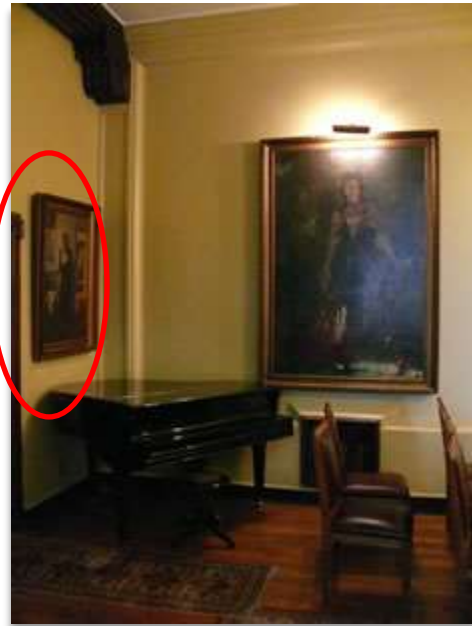
Sala B "Living"