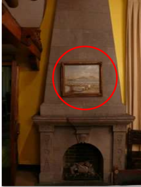
Sala A "Comedor"