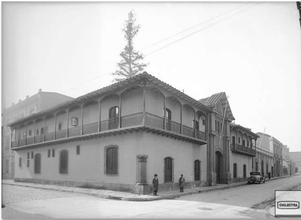
Casa Velasco, Santo Domingo esquina Mac-Iver. 1920 c.

De esta manera la casa ve potenciado su estilo colonial tanto en su exterior: pintando color rojo ladrillo la fachada; la ampliación del segundo piso en los cuerpos restantes, agregó un balcón corrido en toda su fachada y una columna de piedra en su esquina exterior- como en su interior, donde puso rejas, vigas y puertas, muebles adquiridos en anticuarios y otros más modernos pero de estilo “tipo colonial” como podrá observarse más adelante en el detalle del mobiliario. Agregó también algunos escudos heráldicos, entre ellos el de don José Antonio Manso de Velasco, Gobernador de Chile entre 1737 y 1744, pues creyó que el nombre de la casa se debía a ello.