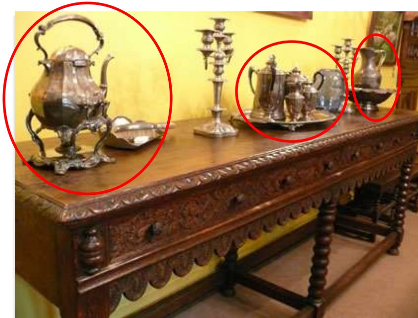
Sala A "Comedor"