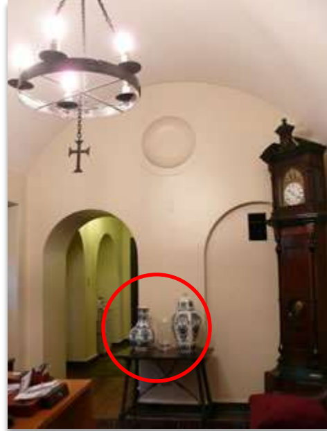
Sala E "Cuidador"