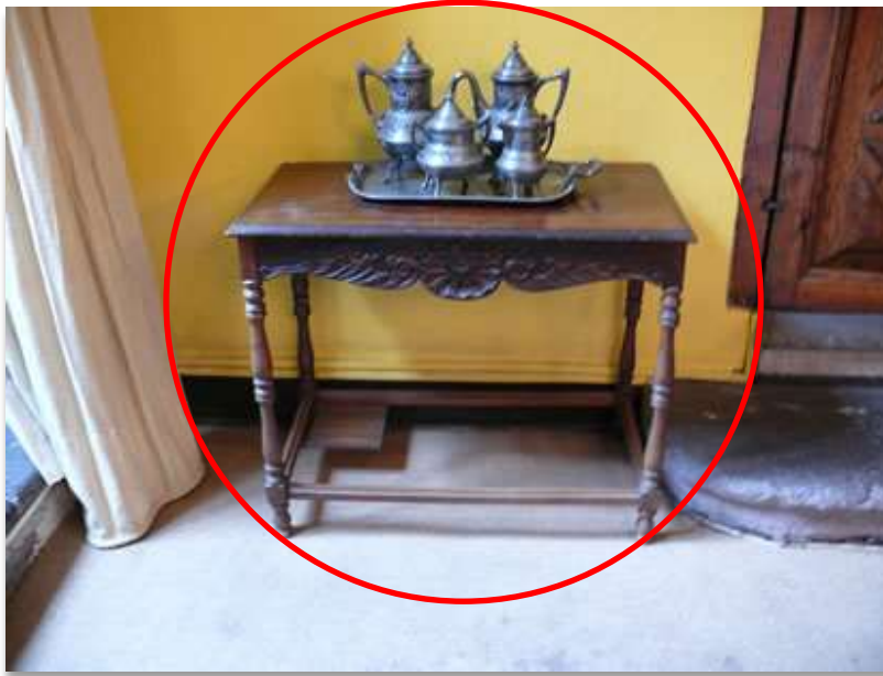
Sala A "Comedor"

Por su parte, las siguientes imágenes corresponden a la Casa Velasco en tiempos del Tribunal Constitucional en las que se señalan las piezas faltantes: