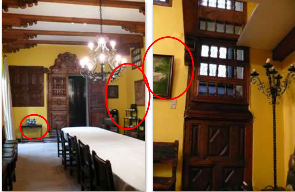
Sala A "Comedor"

Departamento Patrimonio Cultural Áreas Conservación e Investigación Presidencia de la República