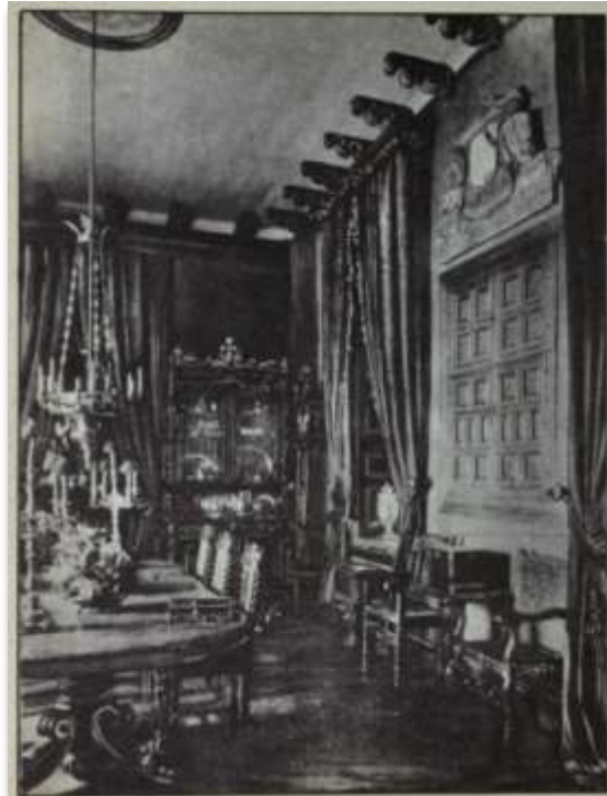
Antigua alacena en el comedor