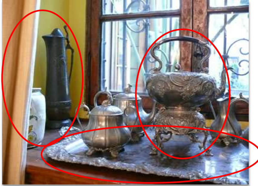
Sala A "Comedor"

Departamento Patrimonio Cultural Áreas Conservación e Investigación Presidencia de la República