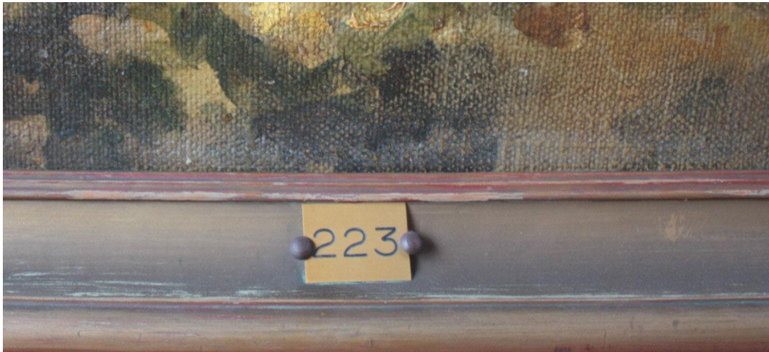
fig. 9: Detalle de las abrasiones del acabado del marco