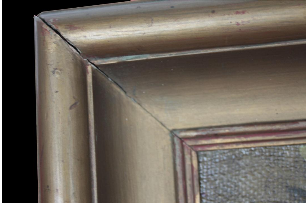
fig. 8 : Detalle de una de las esquinas abiertas del marco