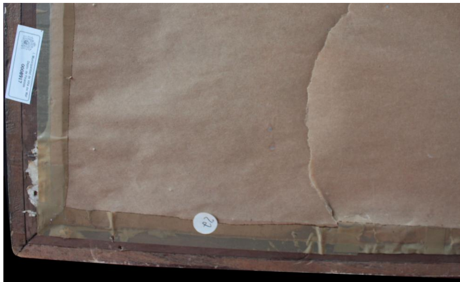
fig. 5: N° inventario que corresponde a la Municipalidad de Viña del Mar