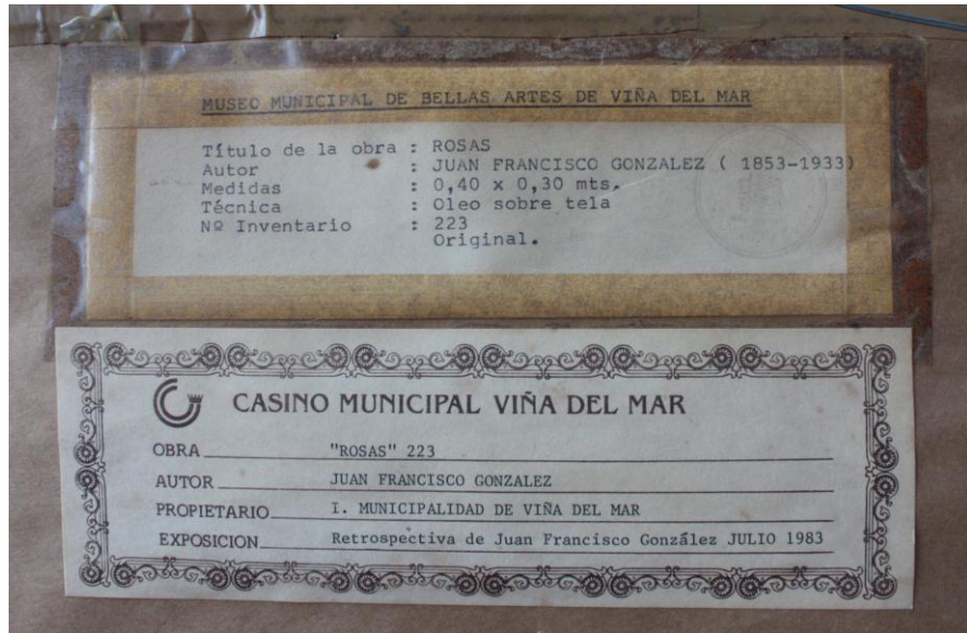
fig. 6: Etiquetas de papel adheridas en el reverso, sobre papel craft. El cual cubre todo el reverso. Estas etiquetas contienen información de la obra y de las exposiciones en las que ha participado.