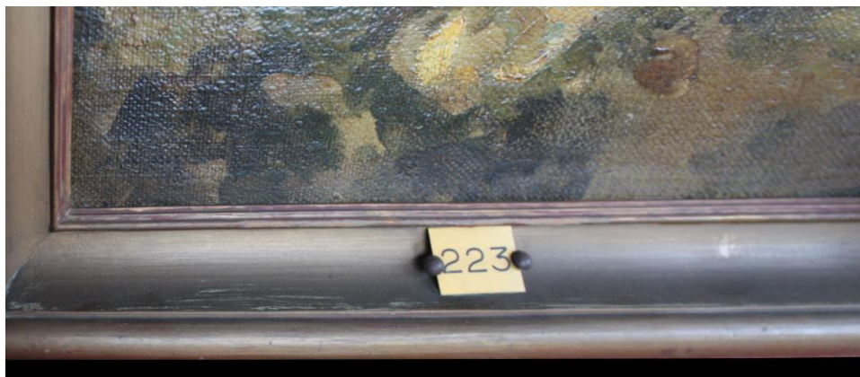
fig. 7: Detalle de la placa de bronce con Nº de inventario, ubicada en la zona central del marco