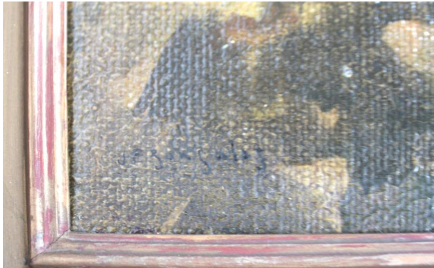
fig. 3: Detalle de la firma, ubicada en la esquina inferior izquierda