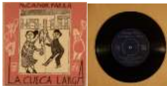
La cueca larga, 1958.