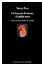
Chistes para desorientar a la poesía, 1983.