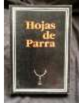
Hojas de Parra, 1985.

Presidencia de la República Departamento de Patrimonio Cultural