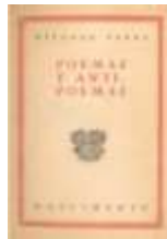
Poemas y Anti-poemas, 1954.