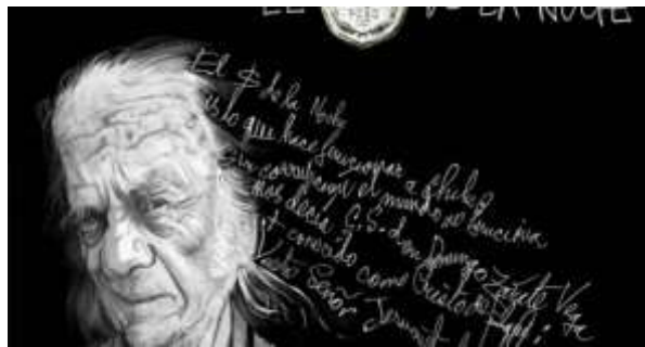
Nicanor Parra 2

El 5 de septiembre de este año Nicanor Parra cumple 101 años de edad. ¡Qué increíble! No es muy común ver que de la mezcla entre las matemáticas y la física emerja uno de los poetas más destacados de nuestro país, aún vivo y que seguirá siendo por siempre parte de nuestra historia. Pero no podemos estar ajenos, debemos conocer más allá su historia personal, como se dice en buen chileno “Lo que se hereda no se hurta”, es decir, en sus venas siempre ha tenido esa beta artística otorgada por sus padres y esa mixtura con lo popular. Su paso por la universidad y su experiencia de vida se fusionaron marcando su estilo propio e inconfundible que nos permite entender su obra, producto de esta maravillosa composición.