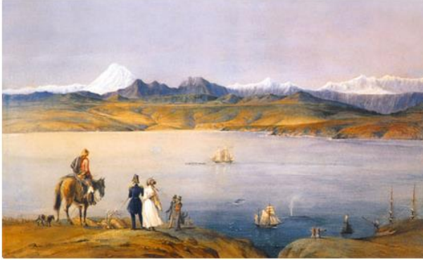
Charles Wood, Valparaíso , 1849, acuarela sobre papel, 46 x 74 cm., Colección Particular.