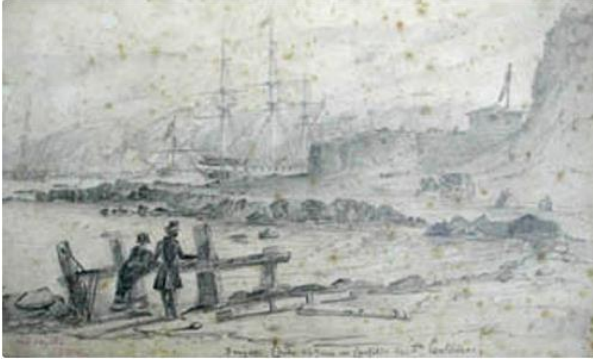
Charles Wood, Castillo de San Antonio , 1846, dibujo a grafito sobre papel, 25 x 39 cm. Museo Nacional de Bellas Artes, Santiago de Chile.

Nacional de Bellas Artes, Santiago de Chile.