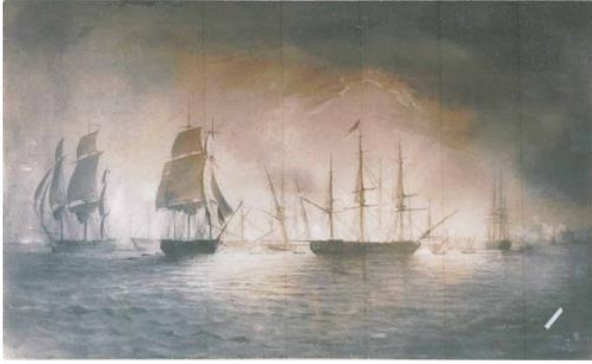
Charles Wood, Toma de la Fragata Esmeralda por la Escuadra de Chile de Lord Cochrane , 1848, acuarela sobre papel, 69 x 49 cm., Museo Nacional de Bellas Artes.