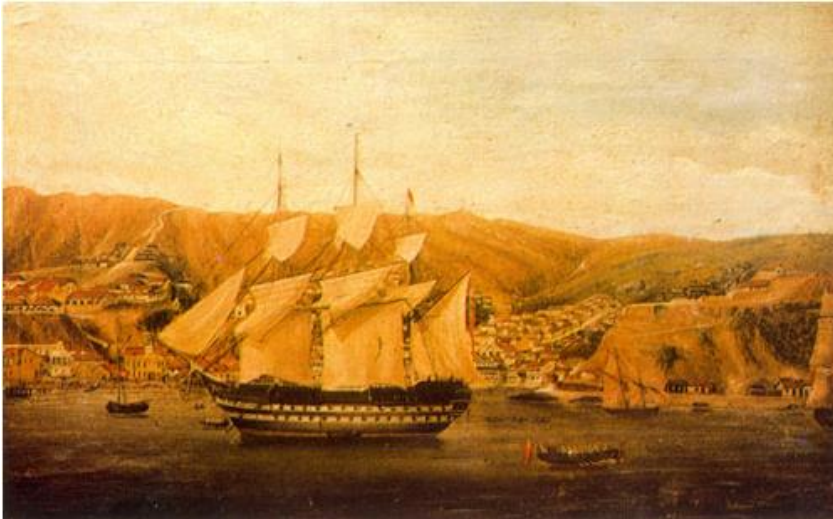
Charles Wood, Vista de Valparaíso , Colección Particular.