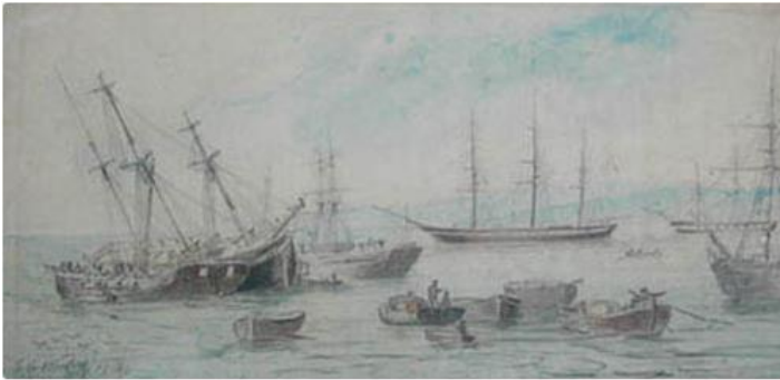
Charles Wood, Careando Buques , 1848, dibujo a lápiz sobre papel, 19 x 38 cm. Museo Nacional de Bellas Artes, Santiago de Chile.