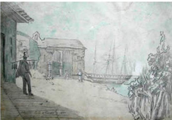
Charles Wood, Buques en Valparaíso , 1857, dibujo a lápiz sobre papel, 22 x 31 cm. Museo