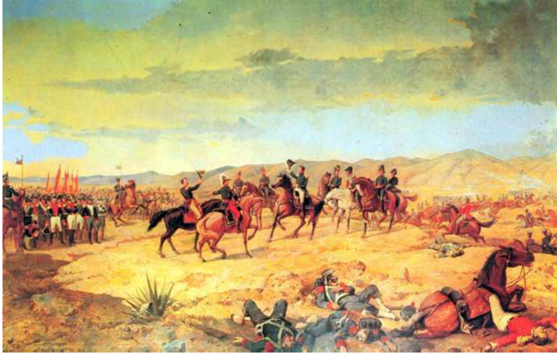
Martín Tovar y Tovar, La Batalla de Ayacucho , ca. 1883.