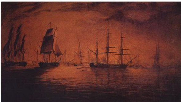
Charles Wood, Captura de la Esmeralda , óleo sobre tela, 66 x 96 cm., Escuela Naval y Armada de