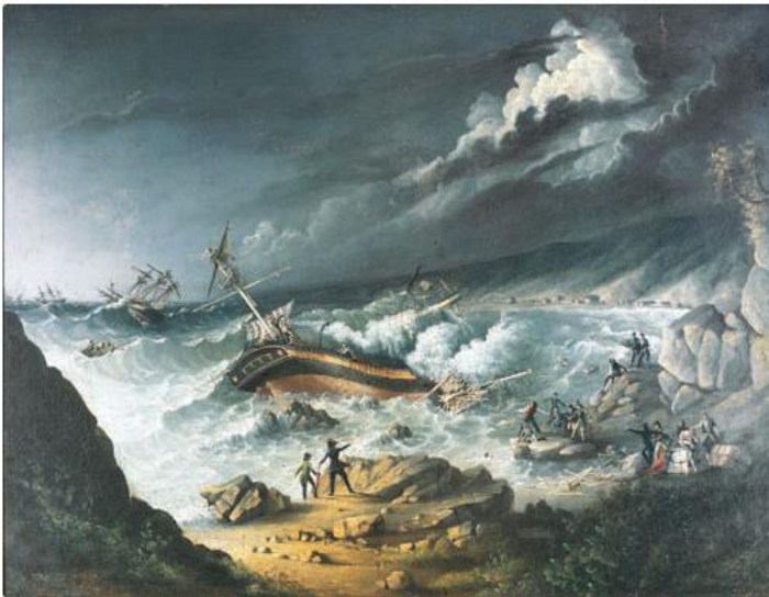
Charles Wood, Nafragio del Arethusa , Valparaíso 1826, óleo sobre tela, 64 x 88 cm., Museo Nacional de Bellas Artes, Santiago de Chile.