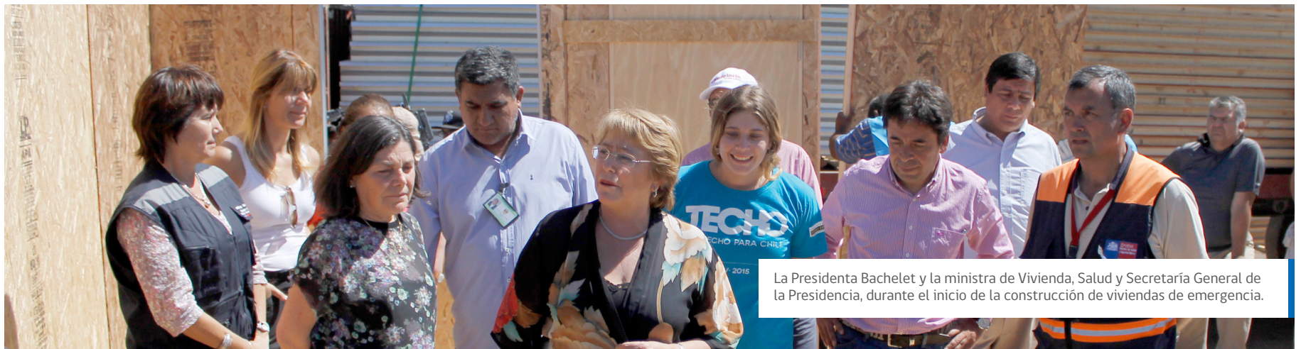
La Presidenta Bachelet y la ministra de Vivienda, Salud y Secretaría General de la Presidencia, durante el inicio de la construcción de viviendas de emergencia.