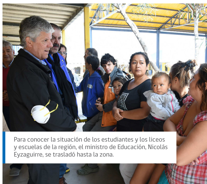
Para conocer la situación de los estudiantes y los liceos y escuelas de la región, el ministro de Educación, Nicolás Eyzaguirre, se trasladó hasta la zona.