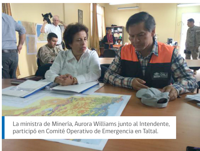
La ministra de Minería, Aurora Williams junto al Intendente, participó en Comité Operativo de Emergencia en Taltal.