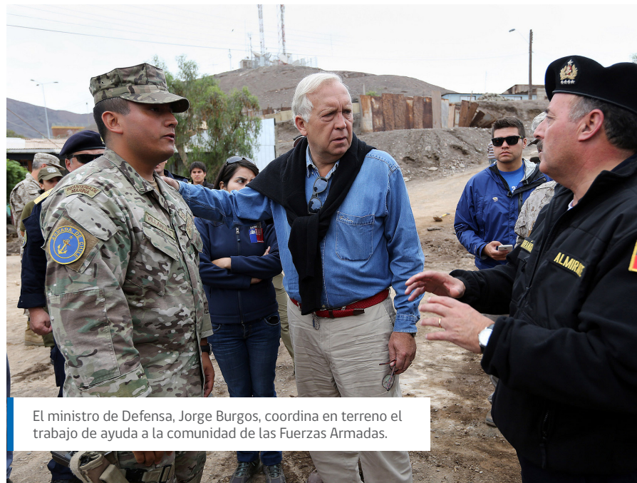
El ministro de Defensa, Jorge Burgos, coordina en terreno el trabajo de ayuda a la comunidad de las Fuerzas Armadas.

Los Puestos de Atención Médica de Emergencia (PAME) son uno de los principales apoyos a la comunidad, especialmente en sectores donde la infraestructura de salud resultó dañada por los aluviones. El Ejército mantiene tres PAME desplegados con medios y personal: en Tierra Amarilla, Diego de Almagro y Chañaral.