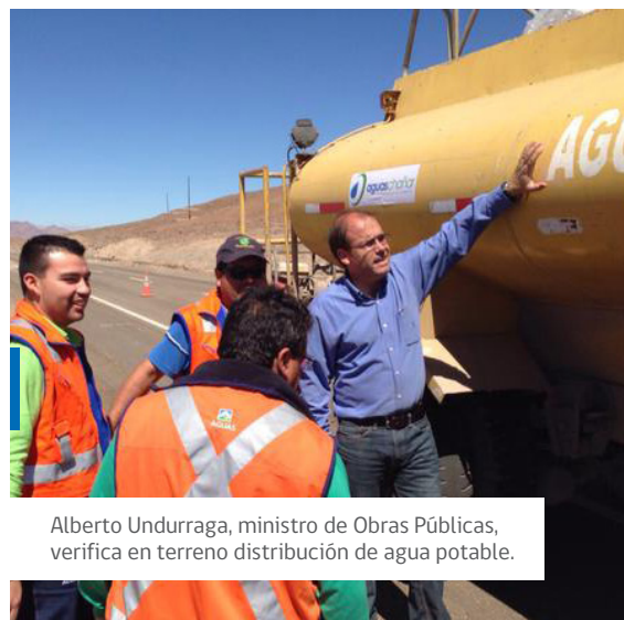
Alberto Undurraga, ministro de Obras Públicas, verifica en terreno distribución de agua potable.

En las comunas de Diego de Almagro, El Salado, Tierra Amarilla, Copiapó, Paipote y Chañaral, el Ministerio de Obras Públicas está coordinando el trabajo de los camiones limpiafosas para retirar las aguas servidas retenidas a causa del lodo de los aluviones.