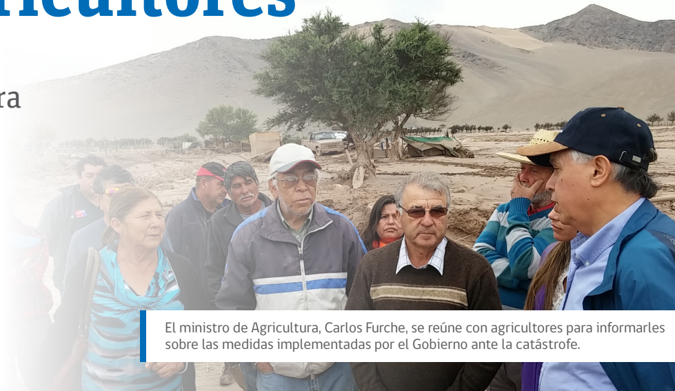
El ministro de Agricultura, Carlos Furche, se reúne con agricultores para informarles sobre las medidas implementadas por el Gobierno ante la catástrofe.

Condonación de cuotas del año 2015 para todos los productores de la región que tengan deudas con Indap. Esta condonación es automática, por lo que no requiere de ningún trámite por parte del agricultor.