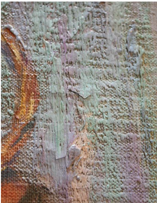
Desprendimiento de capa pictórica