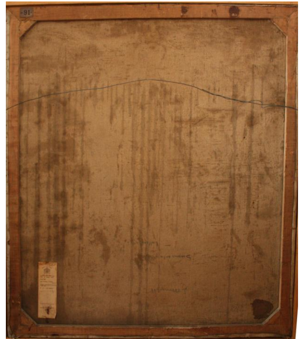
Reverso de la obra