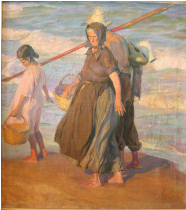
Anverso de la obra