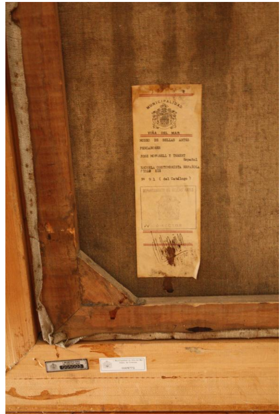
Etiquetas y placas de metal en el reverso de la obra