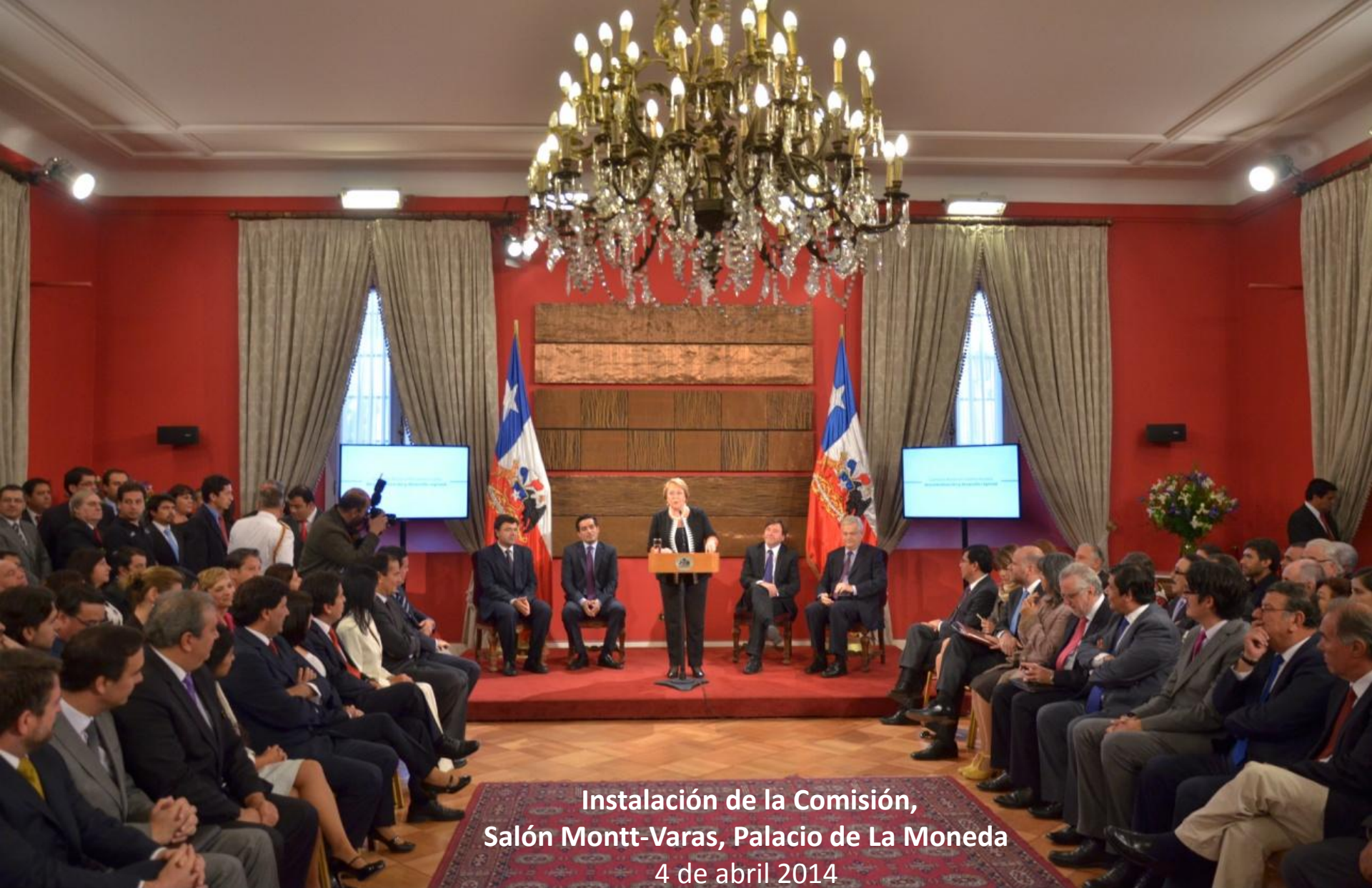
Instalación de la Comisión, Salón Montt-Varas, Palacio de La Moneda 4 de abril 2014